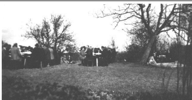
Mindestensfest i Nørtofts have, 5. maj 1946.