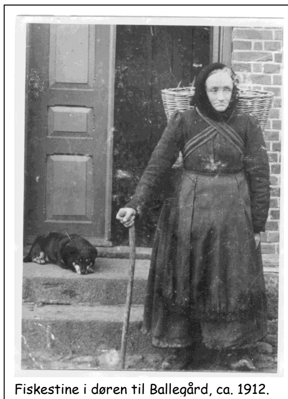
Fiskestine i døren til Ballegård, ca. 1912.

"Fiskestine" kunne mere end sit fadervor! Hun hjalp folk med forskellige salver og kure. Der er også historier om, at hun kunne læse over bulne fingre og på den måde få betændelsen til at forsvinde - hvis man troede på det!