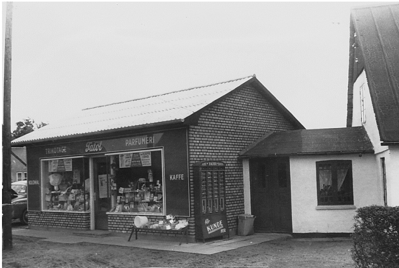
Tatol, Barrit Langgade 70, ca. 1965.