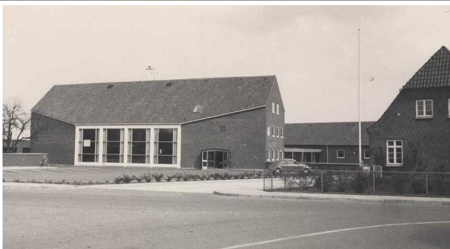
Barrit Sognegård med Barrit Centralskole og skoleinspektør-bolig, ca. 1957

Huset blev ejet af sognefoged Aage Thorborg fra gården overfor fra 1927 til 1983.