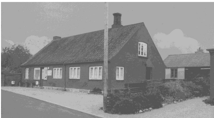
Barrit Langgade 181, ca. 1955.