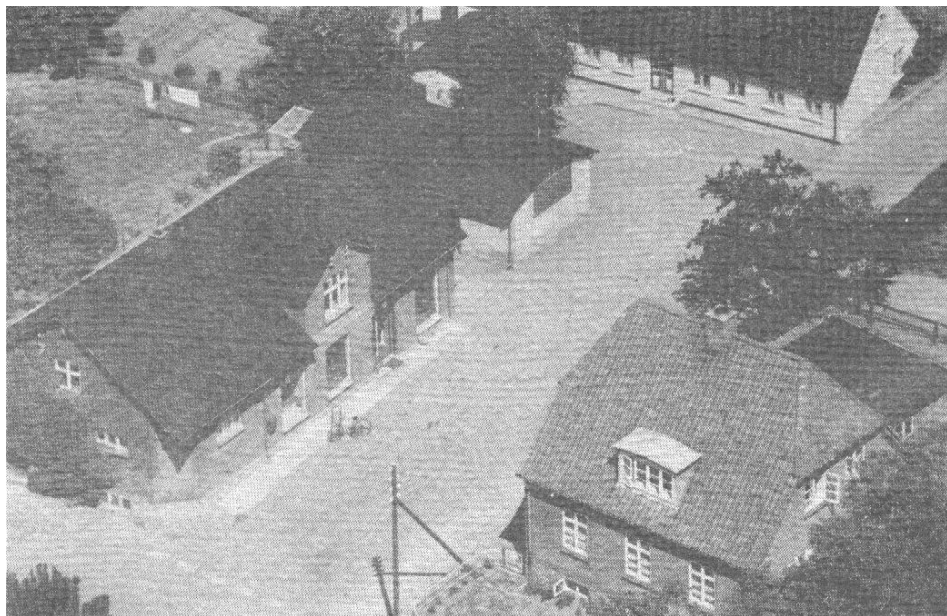
Barritskovby Brugs og Vævergade, 1938 (fra 75-års jubilæumshæftet)