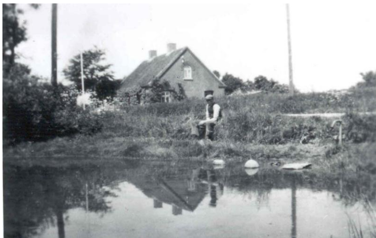
Lundevej 13, 1953.