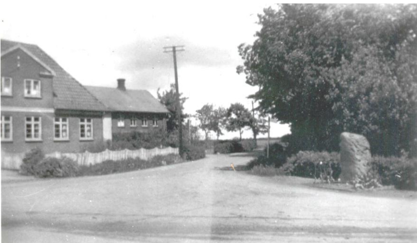
Vrigsteds posthuse, midt i 1950-erne.