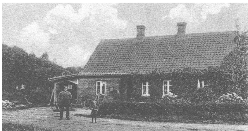
Vrigsted Smedje, Stevnsvej 1, ca. 1930.