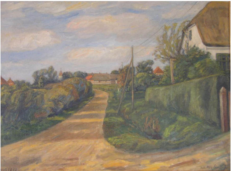
Vrigsted set fra Stevnshuset, 1933