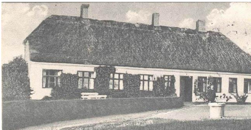
Vrigsted gamle skole, ca. 1928.

Stevnsvej 15 Vrigsted Skole og bibliotek, forsamlingshuset Vrigstedhus: Vrigsted Skole havde til huse i bygningerne indtil 1970, hvor skolen blev nedlagt. Bygningerne blev herefter