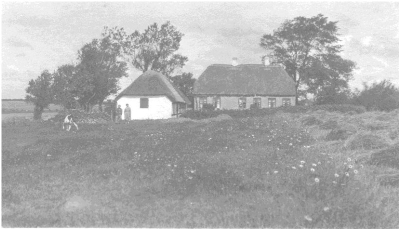
Lundevej 21, Ca. 1930.

sen, og drev en lillebil-forretning og vognmandsvirksomhed herfra frem til 1975.